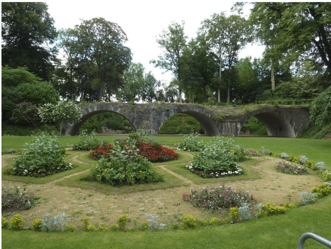
Ancien emplacement de la porte de Fer (un peu plus bas dans le début de la rue de Fer) . - 4 ème enceinte