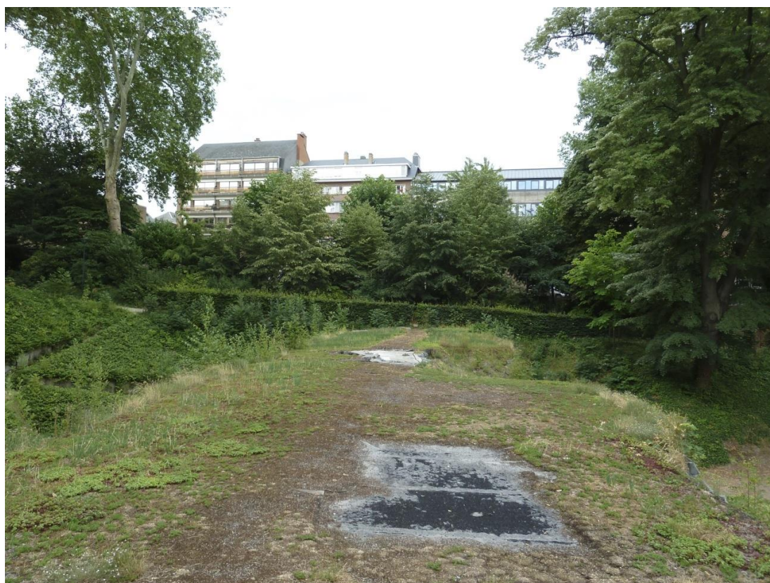
Dans la 4 e enceinte. Reconstituée 60m plus bas que la précédente par les Hollandais au début du 19 e siècle.