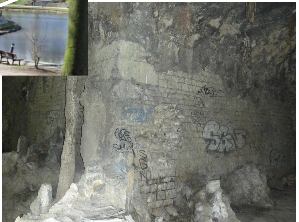
La 4 e enceinte. Situé dans la grotte artificielle du parc Louise Marie.