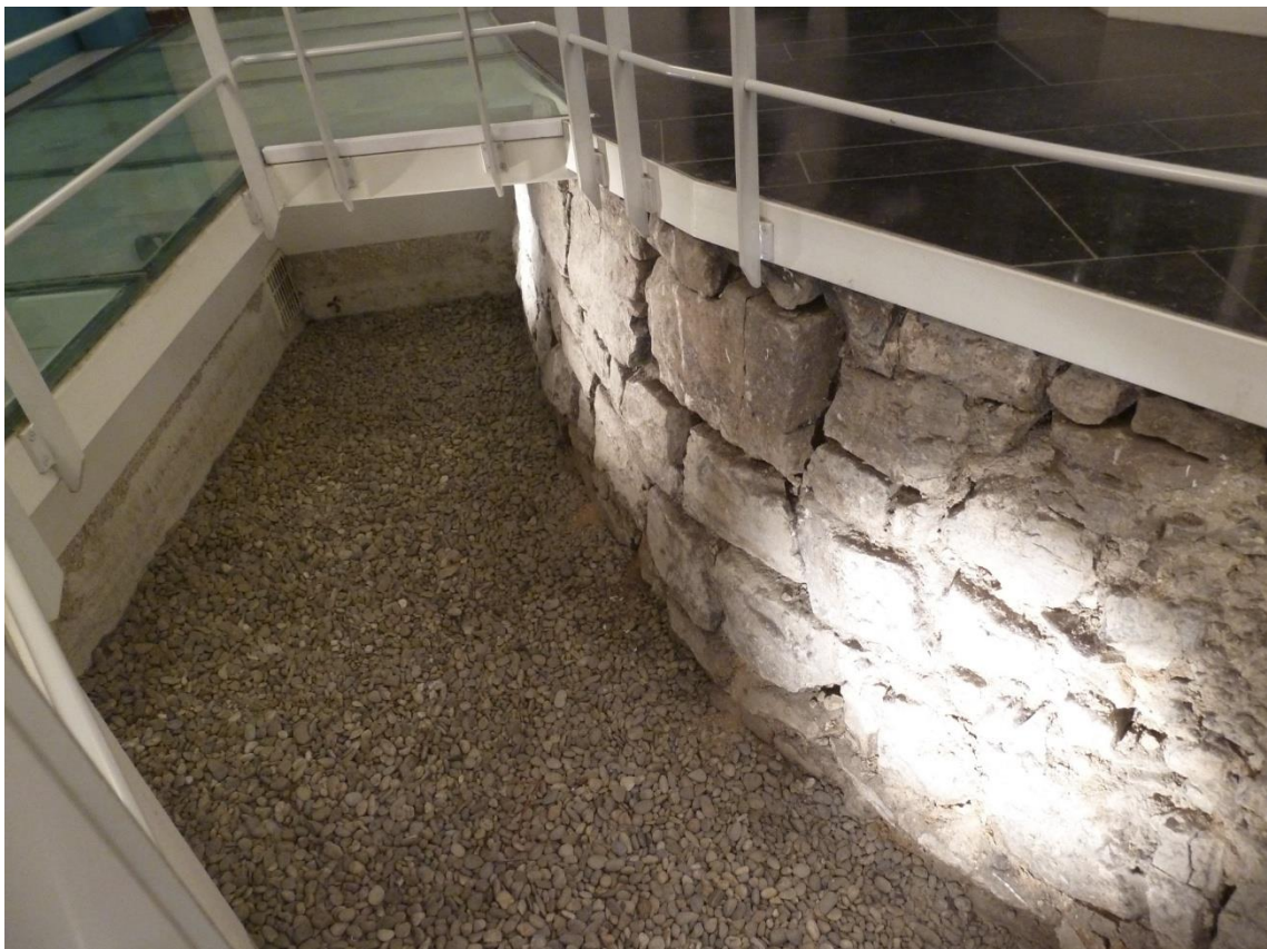
Dans la 2 e enceinte, dans les caves de la banque BNP-Paribas (fin de la rue de l'ange).