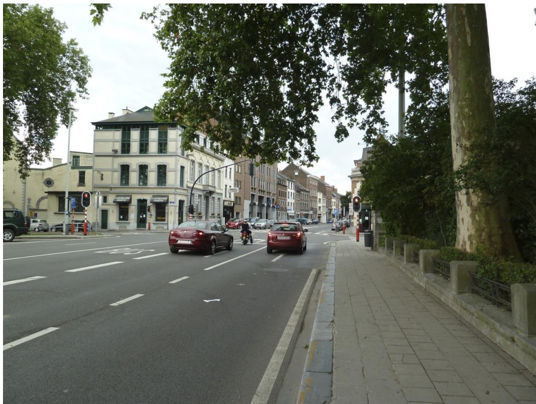
Ancien emplacement de la porte en Trieux ou de Bruxelles – 2 ème emplacement (XIX e S.) – 4 ème enceinte